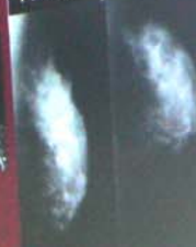
Уплотнение стромального компонента (фиброз) стромы