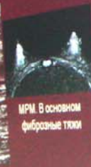
МРМ. В основном фиброзные тяжи